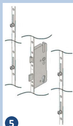
Serrure à rouleaux