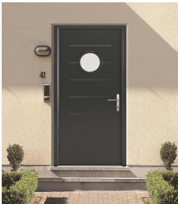
Select 46 045 RAL 7016