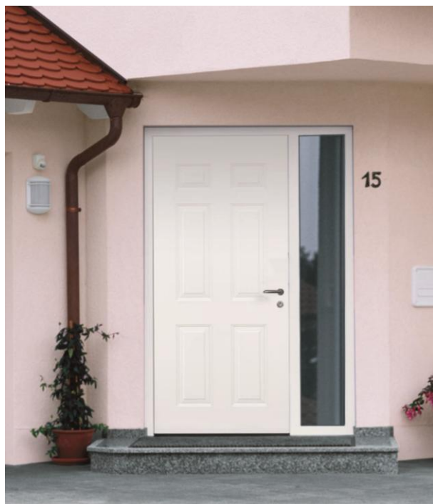
Select46 100 RAL 9016 – Option Partie Latérale Vitrée