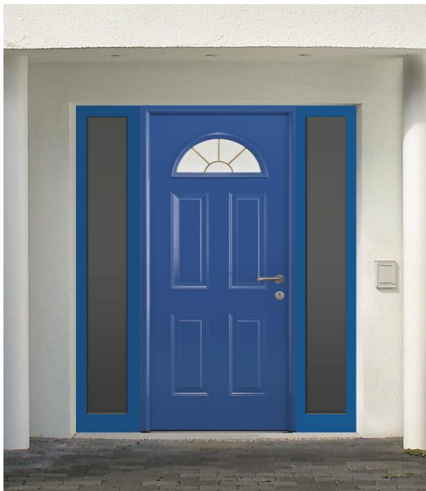
Select 46 210 RAL 5010 – option parties latérales vitrées