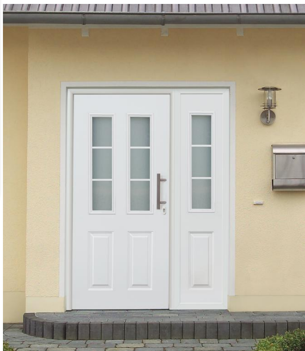
Select46 400 RAL 9016 – Option Barre de tirage HB14-2 et Partie Latérale à cassette Vitrée