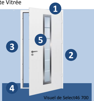
Visuel de Select46 700