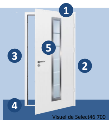
Visuel de Select46 700