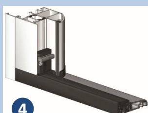
Seuil et joint cornière