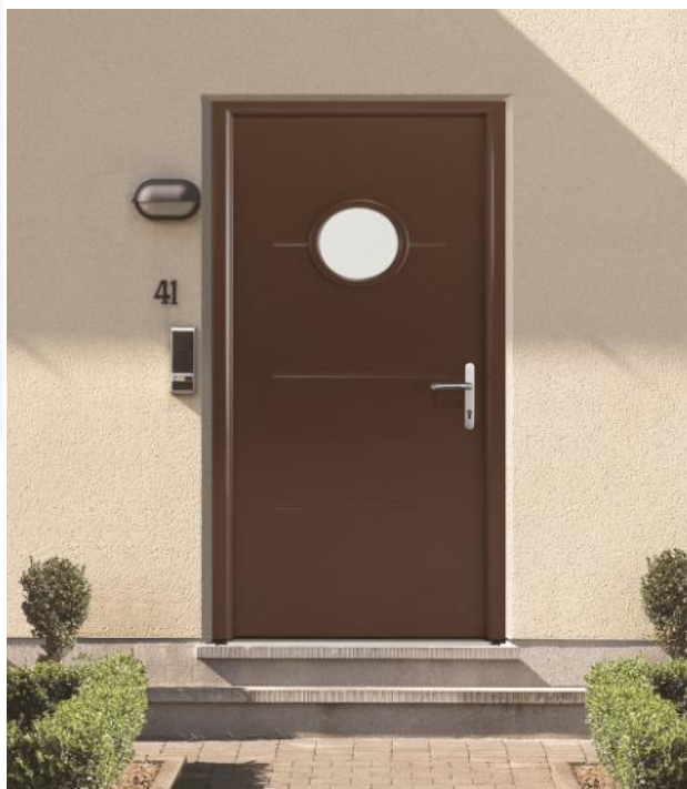
Select46 545 RAL 8028 – Option poignée béquille sur plaque