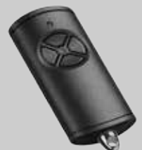
HSE 4 BS