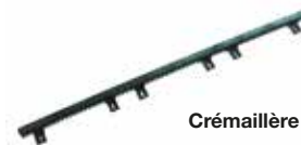
Crémaillère synthétique V6