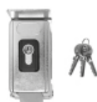
Verrou électrique pour portails à forte prise au vent