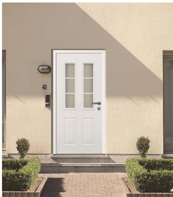
Select46 400 RAL 9016