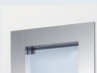
Parclose inox brossé