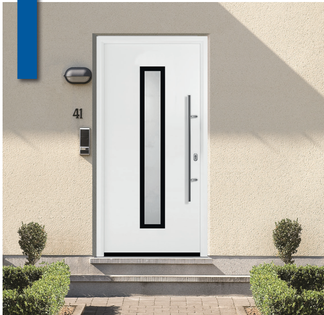
Select65 600 RAL9016