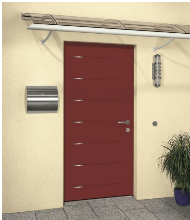
Select46 015 RAL 3003 – motif 401