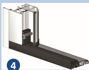
Seuil et joint cornière