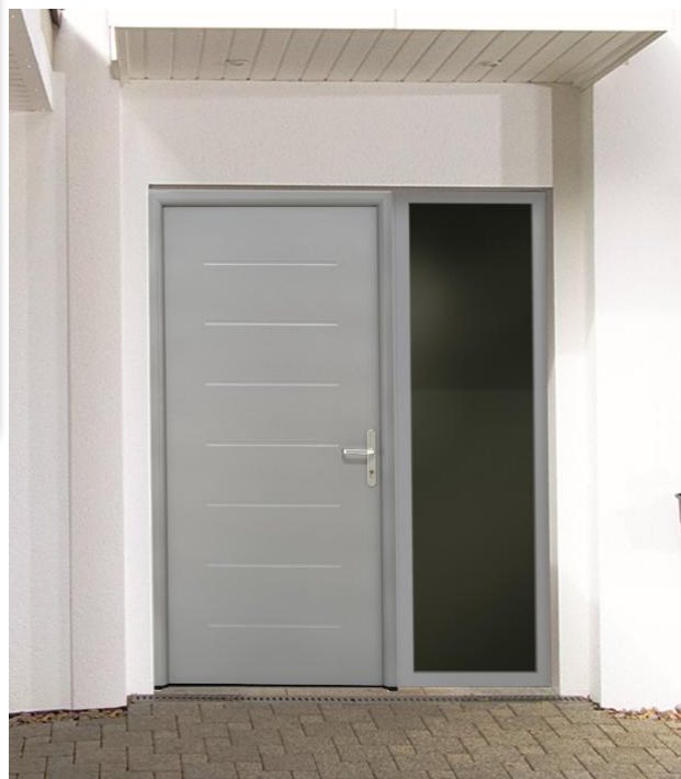
Select 46 515 Chêne doré – Option poignée béquille sur plaque