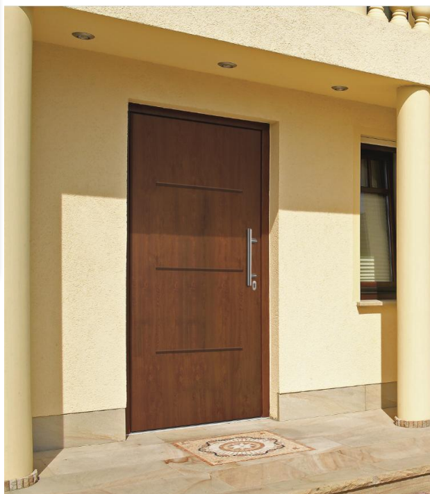
Select46 515 Chêne doré – Option barre de tirage HB14-2