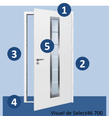
Visuel de Select46 700