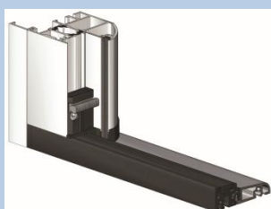
Seuil et joint cornière