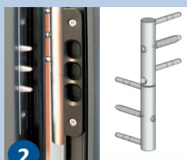
Pions anti-dégond et paumelles