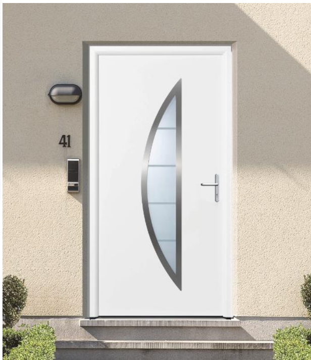
Select46 900 RAL 9016 – Option poignée béquille sur plaque