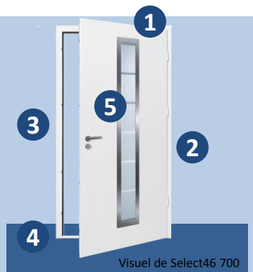
Visuel de Select46 700