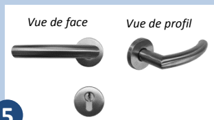
5 Poignée béquille à rosace ronde