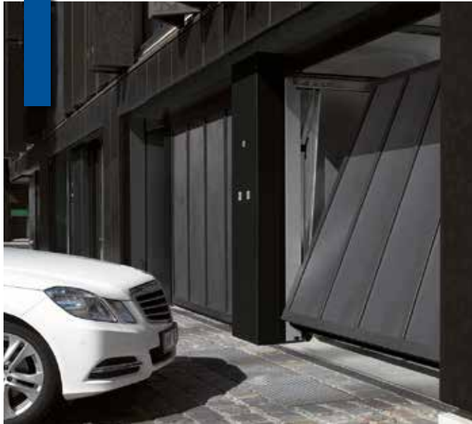
Porte CT 500 motif 420

Porte de garage non débordante avec rails.