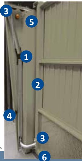
Porte CT 500 motif 414 ventilation basse.