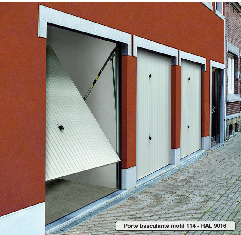
Porte basculante motif 114 - RAL 9016

Porte prémontée avec cadre dormant en acier. Livrée sans barre de seuil.