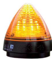
Feu de signalisation