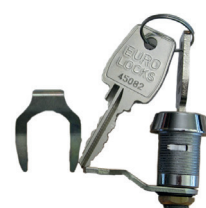
Serrure à came batteuse pour capot de motorisation