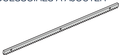
Crémaillère synthétique ou acier à choisir selon le type de fixation