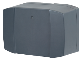
Batterie de secours HNA Outdoor