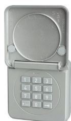
Clavier à code sans fil FCT 10- BS