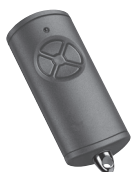
Emetteur 4 touches HSE 4 BS Accessoires de montage