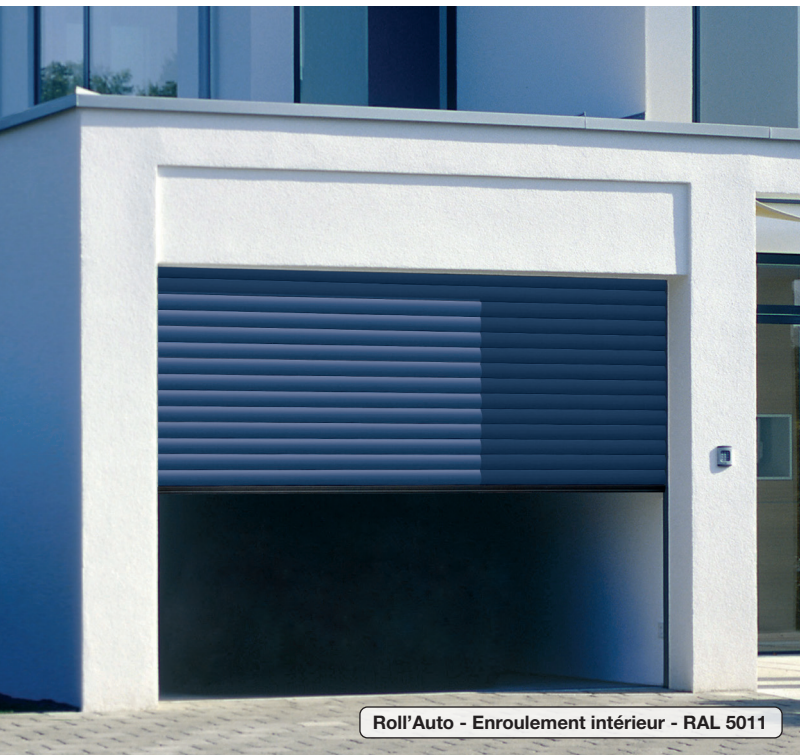
Roll'Auto - Enroulement intérieur - RAL 5011

Porte de garage à enroulement motorisée de série, panneau composé de lames lisses en aluminium, double paroi isolée.